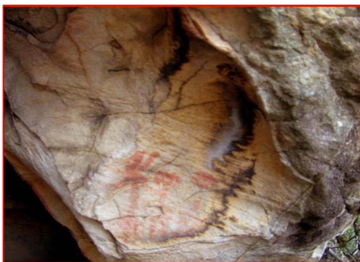
Figura 4.- Castaño I: antropomorfo.

Un poco más hacia el sur se encuentra el puerto del Castaño, donde sobresale una gran peña de forma piramidal en la que hemos localizado los siete abrigos del Castaño. La mayor parte de ellas son pobres en pinturas, que se limitan a puntuaciones, trazos y algunos símbolos. Sin embargo, Castaño I y Castaño IV ofrecen un mayor interés en sus representaciones. Castaño I tiene tres antropomorfos a la entrada con tocados diferentes en la cabeza, uno de ellos parece llevar plumas y está representado de perfil, lo cual no es común en el Arte Esquemático ya que las figuras humanas se representan de frente y son los animales los que aparecen de perfil; y los otros dos llevan tocados parecidos al del arquero del Padrón (fig. 4). Estas pinturas nos recuerdan en gran medida a los antropomorfos representados de la no muy lejana la cueva del Mediano. En Castaño IV también encontramos figuras esquemáticas y una interesante escena formada por una figura humana entre dos figuras animales diferentes a los que señala con los brazos alzados en una actitud invocante o de sujeción. Podríamos sugerir o bien una escena de domesticación, como algunas que aparecen en el Arte Levantino (Selva Pascuala en Villar del Humo, Cuenca) o un ritual totémico, e incluso una escena de caza (fig. 5).