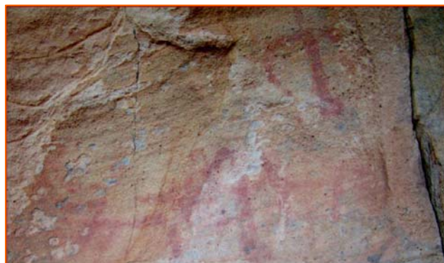
Figura 5.- Castaño IV: escena de antropomorfo y dos zoomorfos.