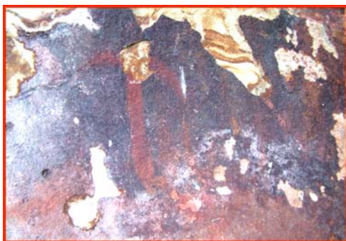
Figura 2.- Molinos I: antropomorfo.

Realizando una descripción de norte a sur comenzaremos por las sierras de Montecoche y Melones. En la primera, y dentro de la finca de la Almoraima, junto al arroyo de la Madre Vieja, encontramos la cueva de Molinos I con representaciones de antropomorfos de gran tamaño (fig. 2), formas ovales y reticulares. En el mismo arroyo está Molinos II, también con antropomorfos y otros dibujos muy deteriorados en los que sólo se perciben manchas.