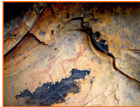
Figura 7- Abrigo del Viento: ciervos.

En la misma sierra Blanquilla, hacia el suroeste y cercanas a la antigua Laguna de la Janda, existen cinco nuevas cuevas. El abrigo de Ojo de Pez en el Pedregoso con dos antropomorfos y una forma oval con punto central que le da nombre al abrigo. La cueva de Corcheros, en el cortijo del Haba cerca de la garganta de las Cañas, tiene las paredes y el techo totalmente ennegrecidas por el fuego, pues los corcheros han usado ese abrigo durante mucho tiempo como refugio. Hoy en día, no obstante, pueden observarse varios conjuntos de puntos, algunos trazos horizontales y otros restos de pintura y no podemos descartar que bajo la cubierta de hollín haya más. Sin embargo, los dos descubrimientos más importantes de este entorno son los abrigos de Navafría y la cueva del Viento. En Navafría, aunque toda la cueva posee restos de pinturas, hay dos pequeños frisos donde podemos apreciar las figuras de zoomorfos de tendencia naturalista y en los que se observa cierta analogía con algunos de los del Tajo de las Figuras. Más interesante es la cueva del Viento porque presenta una bellísima escena de dos ciervos naturalistas, bien proporcionados y de elegante ejecución (fig. 7). En el mismo covacho más a la derecha y en una especie de hornacina natural hay otras