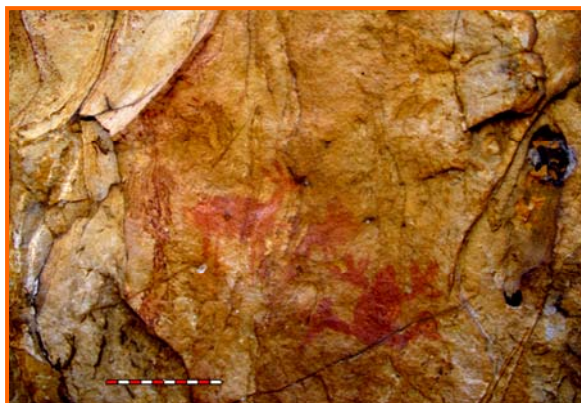
Figura 8.- Abrigo de Fuente de Santa María: rana.