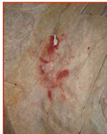
Figura 3.- Padrón: arquero.