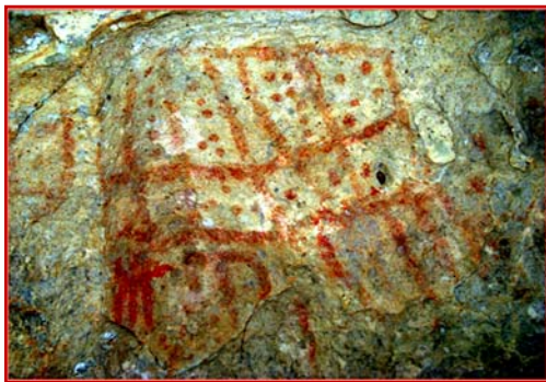
Figura 6.- Abrigo del Alcornoque: estructura.

En la parte este, en la zona de Charco Redondo, hemos localizado el abrigo de Pajarraco II, muy cercano al homónimo publicado por Breuil. Al igual que otros de las sierras gaditanas sólo contiene puntos.