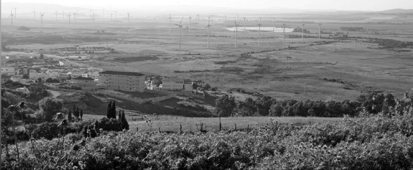
Imagen 1.- Zona de la antigua laguna de La Janda.