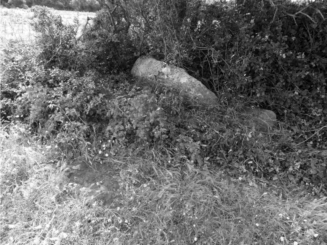
Fig. 2 Dolmen D. Lado NO.